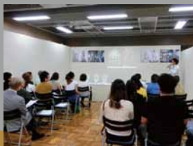
前回の展示会の様子