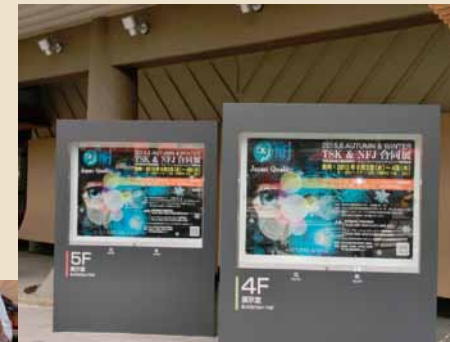
前回の展示会の様子